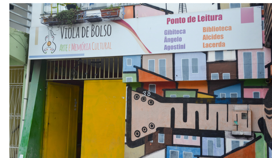
Biblioteca do Viola, no Gusmão

O local se divide entre estrutura física e área ambiental. Tem uma casa de vivência, um palco com o auditório, banheiros e casa de som. Árvores e plantas, hortas e um minhocário, compõem o ambiente. Ali recebemos as escolas municipais em visitas educativas e recebemos grupos que fazem shows musicais, espetáculos de teatro e circo, além de reuniões comunitárias. É nesse espaço, que desde 2022 ocorrem atividades culturais, realizadas pelos ativistas do Viola.