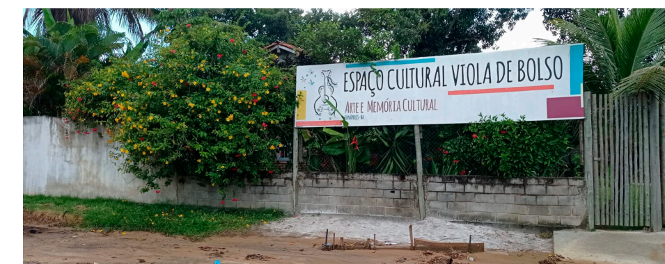
Espaço Cultural do Viola na Colônia

O Viola de Bolso arte e memória cultural é uma instituição cultural sem fins lucrativos, sediada em Eunápolis Bahia, no extremo sul do estado, território chamado de "costa do descobrimento." O Viola de Bolso é Ponto de Cultura no município desde 2008, e atualmente se divide em dois locais: Atua em uma comunidade campesina chamada "Colônia", zona rural de Eunápolis, formada por famílias de trabalhadores rurais, mães diaristas na cidade ou empregadas no comércio local, com seus filhos e filhas, a maioria estudantes do ensino fundamental, beneficiários do 'bolsa família', pessoas com quem o Ponto de Cultura realiza atividades culturais formativas, educativas e de cidadania.